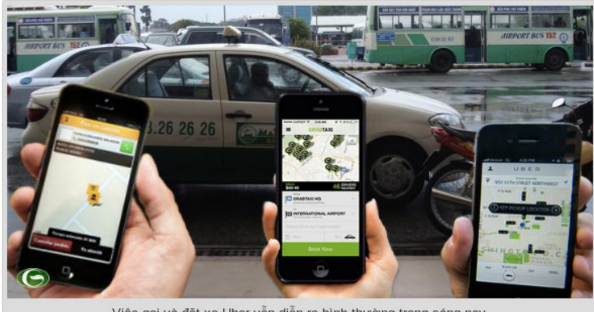
Việc gọi và đặt xe Uber vẫn diễn ra bình thường trong sáng nay.

Như vậy tổng cộng Uber B.V phải nộp số tiền truy thu, phạt và tiền chậm nộp là hơn 66,68 tỉ đồng.